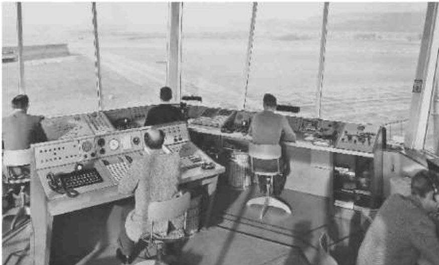
Früher war deutlich weniger los auf den Schweizer Flughäfen.